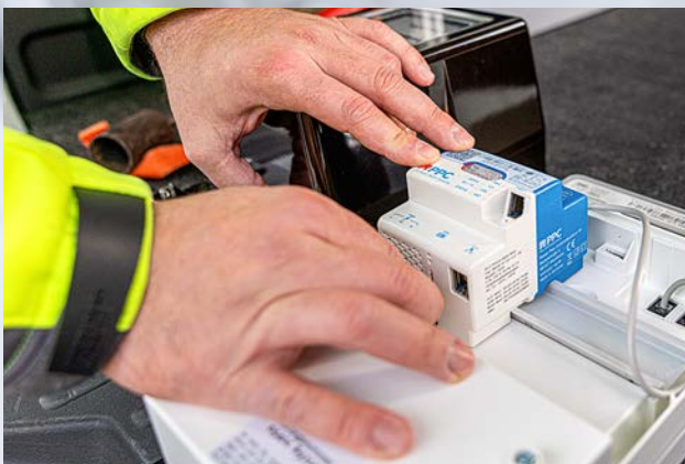
Die Zukunft wird digital: Die neuen Stromzähler werden vom Fachmann mit wenigen Handgriffen eingebaut und übermitteln den Verbrauch.

Die Kosten sind gesetzlich gedeckelt. Für private Haushalte liegen sie – je nach Verbrauch – zwischen 20 und 40 Euro pro Jahr, die über das sogenannte Messentgelt abgerechnet werden. Damit sind Wartung, Betrieb und Kommunikation bereits abgedeckt. Der eigentliche Einbau ist für Sie kostenlos.